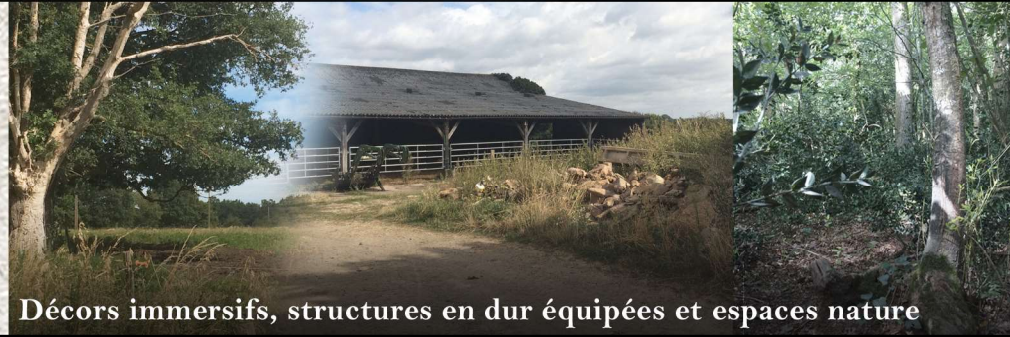
Décors immersifs, structures en dur équipées et espaces nature

Le site de Grandeur Nature dont les Assos, les Joueurs et les Orgas sont propriétaires !